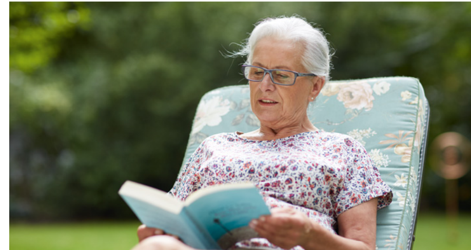
Pflegende Personen dürfen ihre eigene Belastungsgrenze nicht ignorieren und sollten sich von Anfang an Freiräume schaffen.

Für die Hauptpflegeperson ist es wichtig, private Bekanntschaften und Hobbys weiterzuführen. Schaffen Sie sich von Anfang an feste Freiräume, die allein Ihnen gehören, und gönnen Sie sich jeden Tag etwas, worauf Sie sich freuen können, wie etwa ungestört Musik hören, einen Spaziergang machen, eine Zeitschrift lesen oder im Garten arbeiten. Vermeiden Sie unbedingt ein schlechtes Gewissen, wenn Sie sich Zeit für sich nehmen. Sie vernachlässigen den erkrankten Menschen nicht, sondern nehmen sich nur notwendige Pausen. Von der Kraft und guten Laune, die Ihnen ein freier Tag schenkt, profitiert schließlich auch Ihr erkranktes Familienmitglied. Oft suchen pflegende Angehörige erst dann nach Entlastungsmöglichkeiten, wenn sie kurz vor dem Zusammenbruch stehen. Dann erweist sich die Suche jedoch als zusätzlicher Stressfaktor, der kaum noch verkraftet werden kann. Kümmern Sie sich deshalb um Hilfs- und Entlastungsmöglichkeiten, solange Sie noch Zeit dafür haben. Je früher sich der erkrankte Mensch daran gewöhnt, von mehreren Personen Hilfe zu erhalten, desto leichter nimmt er sie auch an.