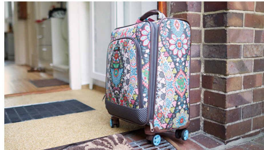
Kleine Auszeiten können helfen wieder neue Kraft für die Pflege zu tanken.

Während der Verhinderungspflege wird bis zu sechs Wochen und während der Kurzzeitpflege bis zu acht Wochen je Kalenderjahr die Hälfte des bisher bezogenen Pflegegeldes weitergezahlt.