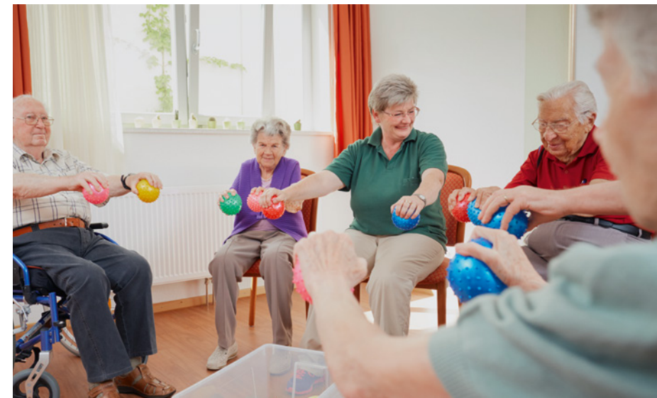
Pflegebedürftige, die stationär versorgt werden, nehmen durch verschiedene Betreuungsangebote am sozialen Leben teil.

Spaziergänge, Vorlesen oder gemeinsames Basteln – was Menschen mit Demenz in häuslicher Pflege guttut, ist auch für an Demenz erkrankte Personen in stationären Einrichtungen eine große Bereicherung ihres Lebens. Das erste Pflegestärkungsgesetz machte es möglich, dass bis zu 20.000 weitere sogenannte „zusätzliche