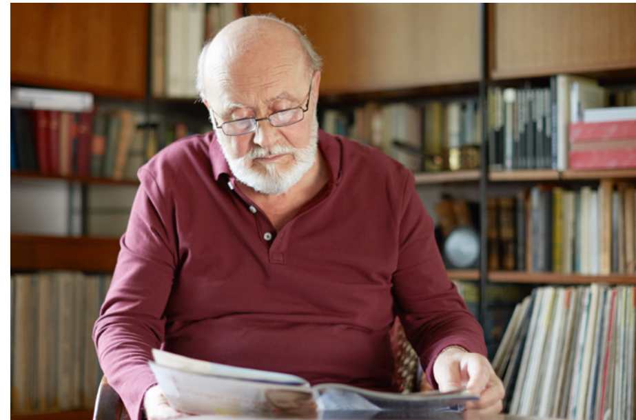
Positiv wirkt sich geistige Aktivität aus: Intellektuell wache Menschen erkranken seltener an Alzheimer.

Je älter die Menschen werden, umso größer ist das Risiko für Demenzerkrankungen. Während in der Altersgruppe der 65- bis 70-Jährigen weniger als drei Prozent an einer Alzheimer-Demenz erkranken, ist im Alter von 85 Jahren ungefähr jeder Fünfte und ab 90 Jahren bereits jeder Dritte betroffen.