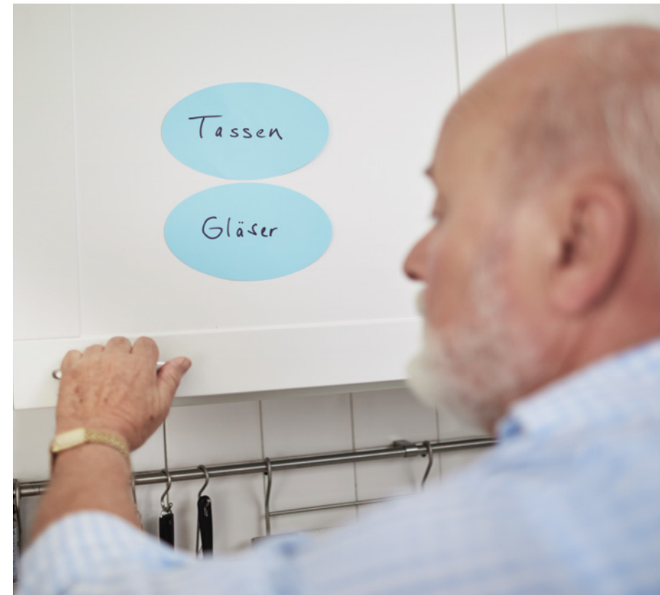
Alzheimer-Patienten benötigen Hilfen zur Orientierung.

Charakteristisch ist ihr schleichender, nahezu unmerklicher Beginn. Anfangs treten leichte Gedächtnislücken und Stimmungsschwankungen auf, die Lern- und Reaktionsfähigkeit nimmt ab. Hinzu kommen erste Sprachschwierigkeiten. Die Erkrankten benutzen einfachere Worte und kürzere Sätze oder stocken mitten im Satz und können ihren Gedanken nicht mehr zu Ende bringen. Örtliche und zeitliche Orientierungsstörungen machen sich bemerkbar. Die Betroffenen werden antriebschwächer und verschließen sich zunehmend Neuem gegenüber.