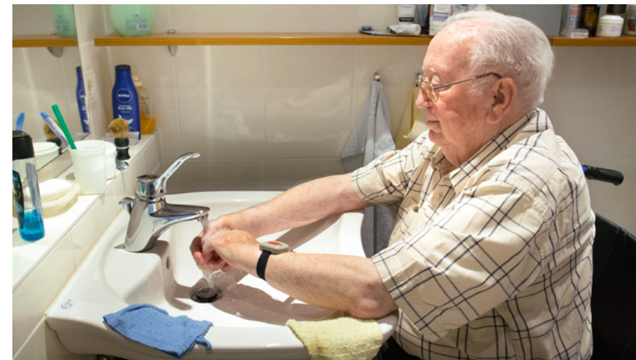
Ein barrierefreies Bad kann die Pflege zu Hause wesentlich erleichtern.

Wer möglichst lange in den eigenen vier Wänden wohnen und dabei ein weitestgehend selbstständiges Leben führen möchte, braucht eine Wohnung, die dies ermöglicht. Dafür muss diese womöglich entsprechend angepasst oder umgebaut werden. Ein barrierefreies Bad, die Anpassung einer Kücheneinrichtung oder die Beseitigung von Schwellen können die Pflege zu Hause wesentlich erleichtern und zugleich vor Unfällen schützen. Die Pflegeversicherung unterstützt deshalb bauliche Anpassungsmaßnahmen durch finanzielle Zuschüsse. Bereits ab Pflegegrad 1 können Betroffene diese Zuschüsse in Höhe von bis zu 4.000 Euro je Maßnahme für Anpassungen