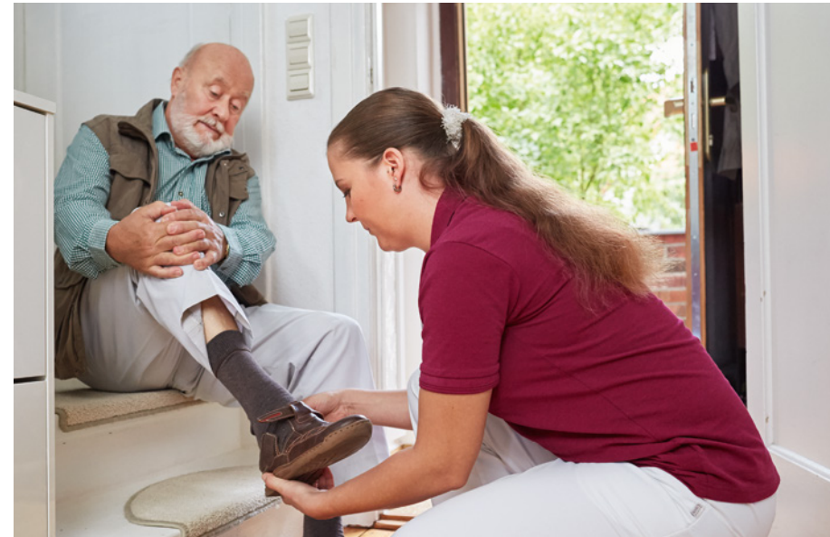
Leistungen der ambulanten Pflegedienste lassen sich „maßgeschneidert“ für die persönliche Lage auswählen.

Diese tragen dazu bei, Pflegepersonen zu entlasten, und helfen Pflegebedürftigen, möglichst lange in ihrer häuslichen Umgebung zu bleiben, soziale Kontakte aufrechtzuerhalten und ihren Alltag weiterhin möglichst selbstständig bewältigen zu können.