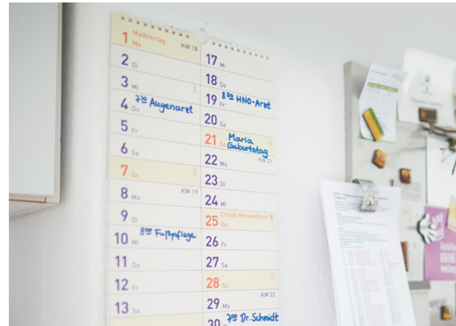
Zahlreiche Unterstützungsangebote helfen im Alltag dabei, Beruf und Pflege unter einen Hut zu bringen.

Während dieser maximal zehn Tage erhalten Arbeitnehmerinnen und Arbeitnehmer ein sogenanntes Pflegeunterstützungsgeld. Beim Pflegeunterstützungsgeld handelt es sich um eine Entgeltersatzleistung, deren Höhe wie beim sogenannten Kinderkrankengeld berechnet wird. Damit werden als Brutto-Pflegeunterstützungsgeld 90 Prozent (bei Bezug beitragspflichtiger Einmalzahlungen in den letzten zwölf Monaten vor der Freistellung 100 Prozent) des ausgefallenen Nettoarbeitsentgelts gezahlt. Der Schutz in der Kranken-, Pflege-, Renten- und Arbeitslosenversicherung bleibt bestehen. Das Pflegeunterstützungsgeld muss bei der Pflegeversicherung des pflegebedürftigen Familienmitglieds beantragt werden. Auch hierfür ist die ärztliche Bescheinigung vorzulegen. Der Arbeitgeber muss sofort informiert werden.