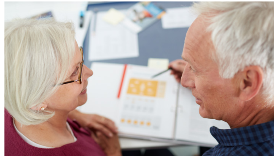
Die Pflegeberaterinnen und -berater helfen Ihnen, aus den verschiedenen Angeboten die für Ihre Pflegesituation passenden Leistungen zusammenzustellen.

Die Pflegekassen benennen Ihnen eine Pflegeberaterin oder einen Pflegeberater, der Ihnen hilft, aus den verschiedenen Angeboten die für Ihre Pflegesituation passenden Leistungen und Angebote zusammenzustellen. Die Beratung hat dabei frühzeitig, umfassend und kostenlos zu erfolgen. Wenn Sie einen Antrag auf Pflegeleistungen stellen, bietet Ihnen die Pflegekasse von sich aus einen Beratungstermin an, der spätestens innerhalb von zwei Wochen nach Eingang des Antrages durchzuführen ist. Alternativ hierzu kann Ihnen die Pflegekasse auch einen Beratungsgutschein ausstellen. In diesem sind unabhängige und neutrale Beratungsstellen benannt, bei denen Sie sich zulasten der Pflegekasse ebenfalls innerhalb der Zwei-Wochen-Frist kostenlos beraten lassen können. Die Pflegeberaterinnen und -berater kommen auf Wunsch auch zu Ihnen nach Hause, auch zu einem späteren Zeitpunkt. Sie nehmen sich Ihrer Sorgen an, informieren umfassend über die verschiedenen Leistungs- und Unterstützungsangebote und begleiten Sie in der jeweiligen Pflegesituation.