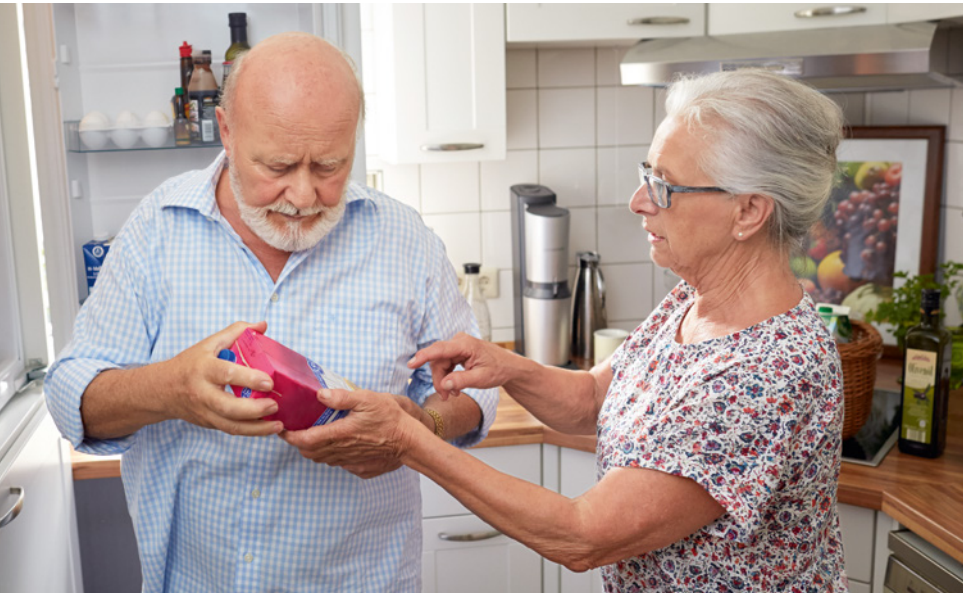
Menschen mit Demenz tut es gut, wenn man sie bei vertrauten Tätigkeiten wie Tischdecken oder Küchenarbeit einbezieht.

Viele Aufgaben werden von den Betroffenen nicht mehr so ausgeführt, dass sie den Maßstäben Gesunder genügen. Wichtiger als Perfektion ist aber, dass der erkrankte Mensch sich angenommen und nützlich fühlt – und Spaß bei seinem Tun empfindet. Werden beispielsweise beim Tischdecken die Untertassen vergessen oder das Besteck falsch angeordnet, sollte dies nicht unmittelbar vor den Augen der Kranken korrigiert werden, sondern eher dezent zu einem späteren Zeitpunkt. Kritik belastet an Demenz erkrankte Menschen enorm, da sie der Argumentation meist nicht mehr folgen können. Lob hingegen aktiviert und tut gerade den Kranken besonders gut. Sinnvoll sind auch sanfte Hilfestellungen, die die Arbeitsprozesse in überschaubare kleine Schritte gliedern. Bereitet