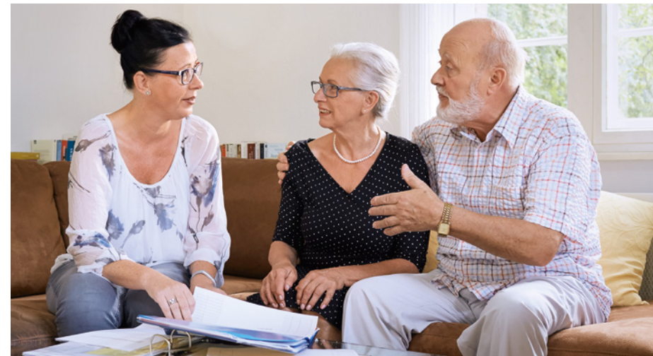
Gutachterinnen und Gutachter kommen ausschließlich nach vorheriger Terminvereinbarung zu Ihnen nach Hause.

Die jeweilige Gutachterin oder der jeweilige Gutachter kommt ausschließlich nach vorheriger Terminvereinbarung in die Wohnung oder die Pflegeeinrichtung – es gibt keine unangekündigten Besuche. Zum Termin sollten idealerweise auch die Angehörigen oder Betreuer des erkrankten Menschen, die ihn unterstützen,