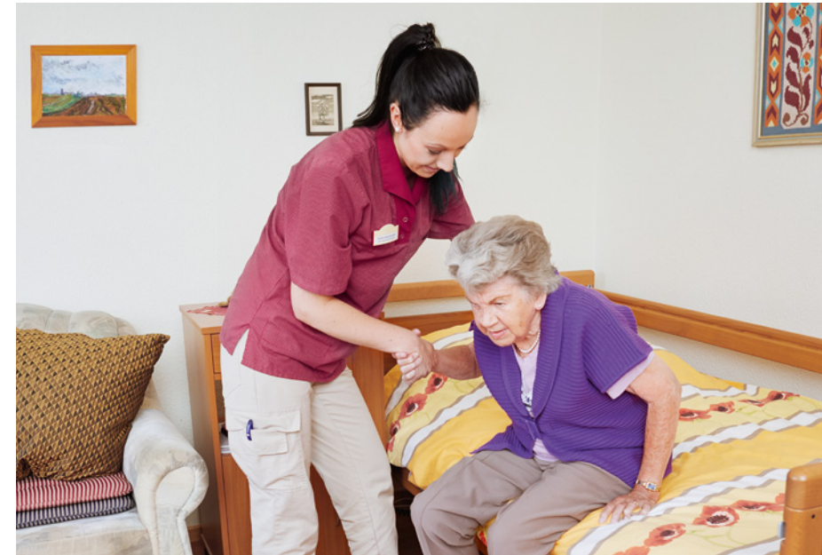
In einer stationären Einrichtung ist für eine umfassende pflegerische Betreuung gesorgt.

Altenheime gewährleisten älteren Menschen, die ihren Haushalt nicht mehr eigenständig führen können, pflegerische Betreuung und hauswirtschaftliche Unterstützung. Auch hier leben die Bewohnerinnen und Bewohner oft in eigenen kleinen Wohnungen oder Apartments.