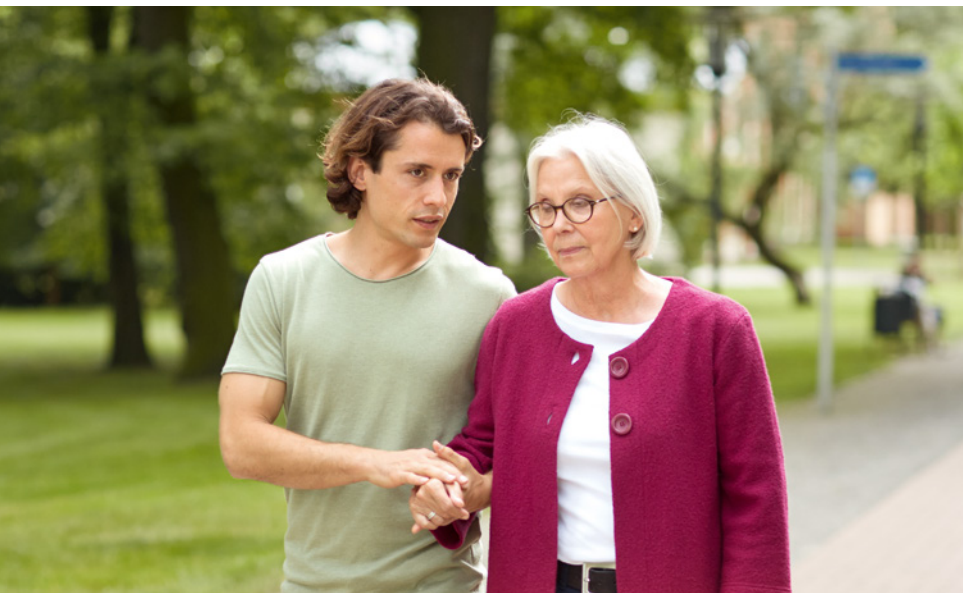
Aufmerksamkeit, Ansprache und Orientierung sind für Menschen mit Demenz sehr wichtig.

Bei der dauerhaften Pflege von an Demenz Erkrankten werden die Betreuenden mit einer Reihe unterschiedlicher Gefühle konfrontiert. Angst spielt oft eine große Rolle. Das mag die Furcht davor sein, dass sich der betroffene Mensch verletzt oder einen Unfall hat, oder die Sorge darum, was aus ihm wird, wenn einem selbst etwas zustößt. Es ist wichtig, dass sich pflegende Angehörige, sobald ihre Ängste überhandnehmen, Beratung holen. Hilfreich können Gespräche mit einer Ärztin beziehungsweise einem Arzt oder etwa einem Geistlichen sein. Hinzu kommen Abschied und Trauer. Leben mit einem an Demenz erkrankten Familienangehörigen oder Freund bedeutet ein langes und schmerzvolles Abschiednehmen von einem vertrauten Menschen, seinen Wesenszügen und Fähigkeiten sowie von gemeinsamen Zukunftsplänen. Versuchen Sie, gemeinsam ein möglichst positives Verhältnis zu der neuen