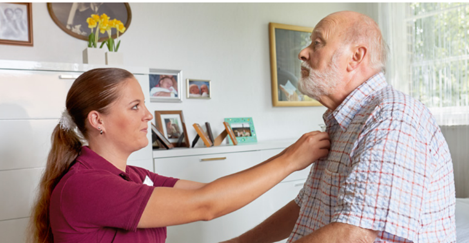
Menschen mit einer Demenzerkrankung benötigen Hilfe bei der Körperpflege und auch beim An- und Ausziehen.

So lassen sich manche Betroffene auch ungern von Verwandten – vor allem von den eigenen Kindern – waschen. In diesem Fall empfiehlt es sich, für die Körperpflege eine professionelle Pflegekraft